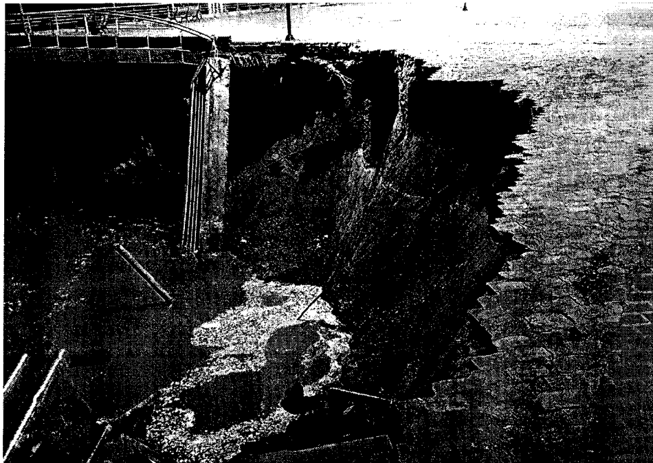
Imagen del derrumbe – costanera central de Rosario

Defensa Civil informó que quedará clausurada una zona cercana al playón y remarcaron que se cayeron entre 15 y 20 metros de barranca, desde una altura que oscila entre los 8 y 10 metros.